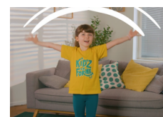
L'activité physique et les écrans

Ces programmes TV ont été réalisés en partenariat avec le programme VIF ® « Vivons en Forme® », programme de prévention santé dont les objectifs sont de garantir la santé et le bien-être de tous, prévenir le surpoids et l'obésité chez l'enfant, et contribuer à réduire les inégalités sociales de santé en matière d'alimentation et d'activité physique.