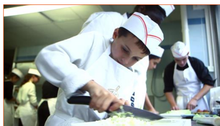
La Fondation Paul Bocuse pour leurs Ateliers « Valorisation des métiers de bouche »