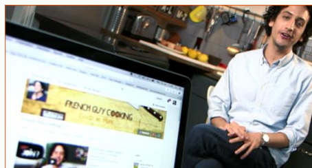
French Guy Cooking pour ses vidéos sur Internet dans lesquelles il se met en scène en train de faire la cuisine