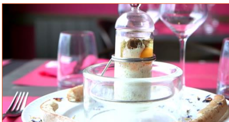
Cookal SA pour son Cooketier Ou comment théâtraliser la cuisson de l'œuf en plein repas ?