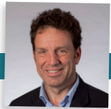
Geoffroy Roux de Bézieux